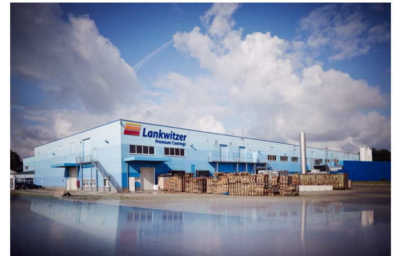
Lankwitzer Lackfabrik GmbH