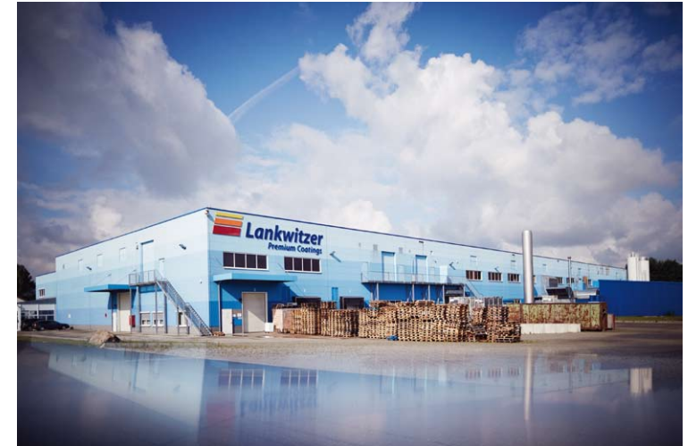
Lankwitzer Lackfabrik GmbH